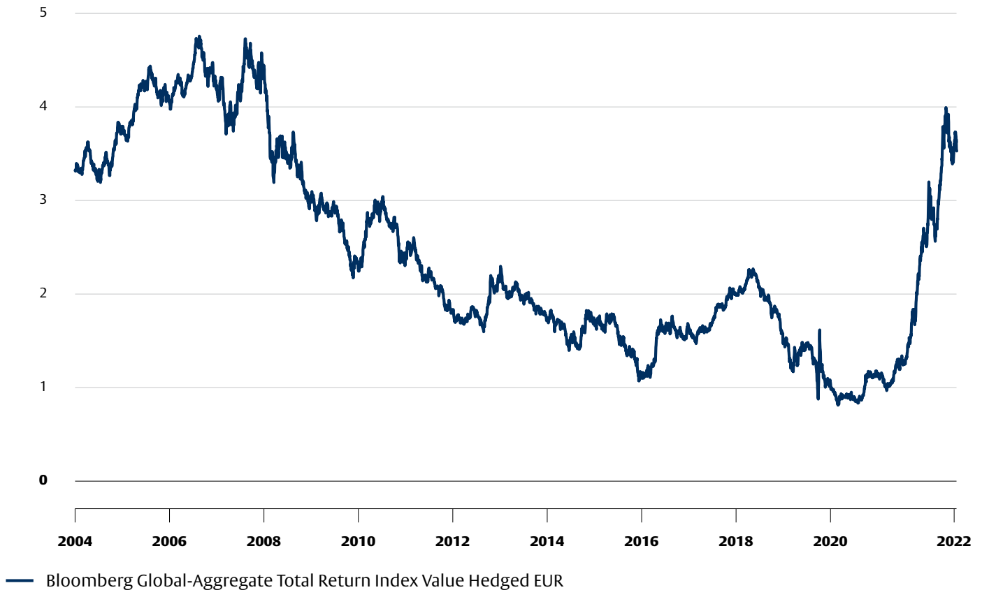
Grafiek 1 Waarom in obligaties beleggen? – De rendementen zijn hoger dan ze lange tijd geweest zijn.

De Bloomberg Global Aggregate Index volgt de prestaties van wereldwijde investment grade obligaties uit 24 lokale valutamarkten. Deze multi-valuta benchmark omvat staatsobligaties, quasi-overheidsobligaties, bedrijfsobligaties en geëffectiseerde vastrentende obligaties van emittenten in ontwikkelde en opkomende markten. De index is afgedekt in EUR en heeft dus geen open valutapositie. Historische prestaties zijn geen indicator voor huidige of toekomstige prestaties.